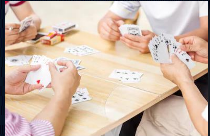
Грци играју карте за срећу