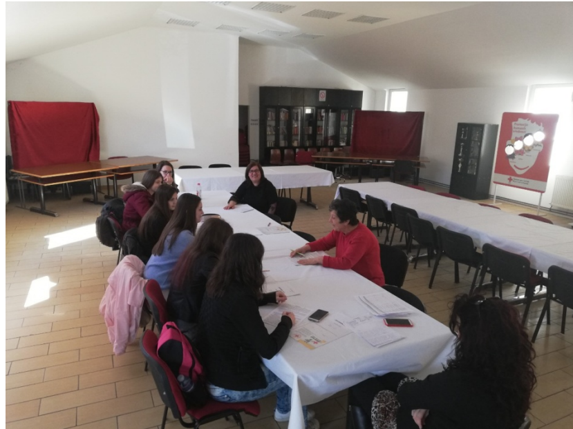
Секција школске организације Црвеног крста Медицинске школе.